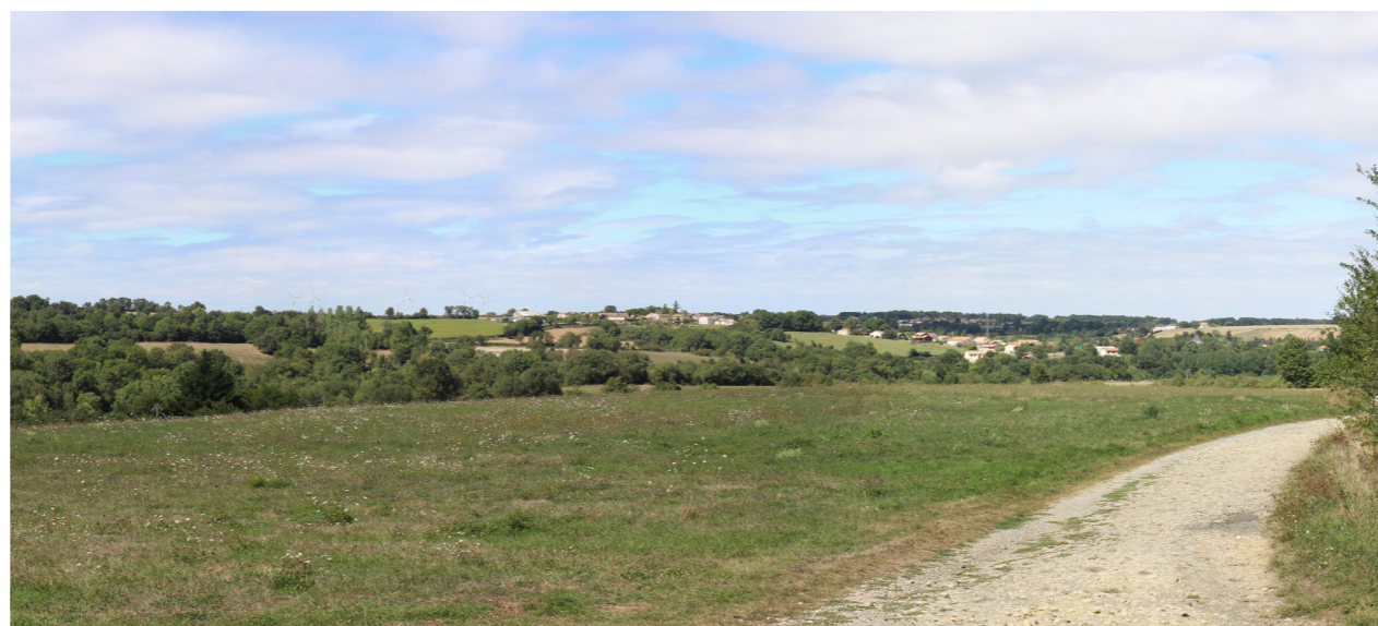
Photographie de l'état initial à 50°